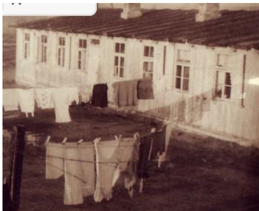
Typisk barak fra et ukendt sted.

I en skrivelse som Lemvigs daværende borgmester sendte til en overordnet myndighed gjorde han opmærksom på at det kun var nogle af de små lejre der havde mad til bospisningen. Heraf må man kunne slutte, at der så også var lejre der, manglede forplejning og mad til flygtningene.