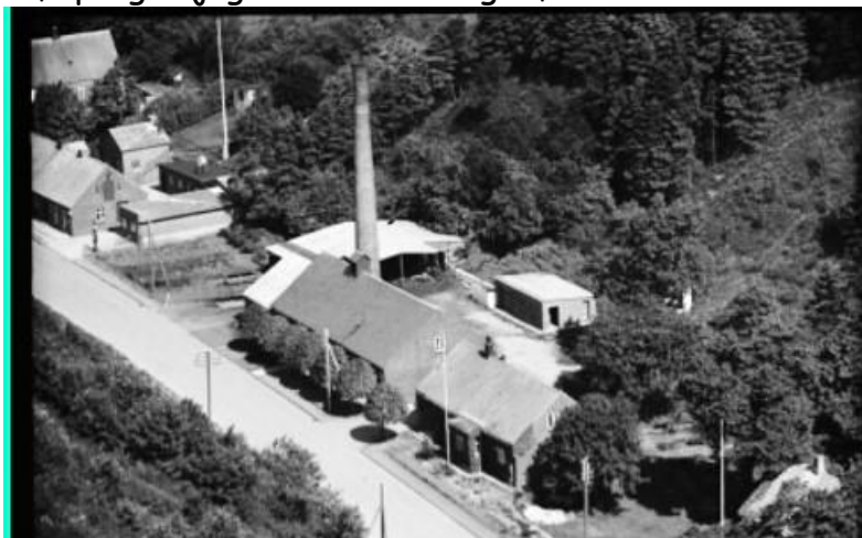
Foto med lægebolig øverst i venstre hjørne