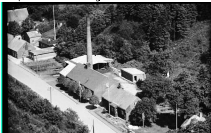
Foto med læge bolig øverst i venstre side