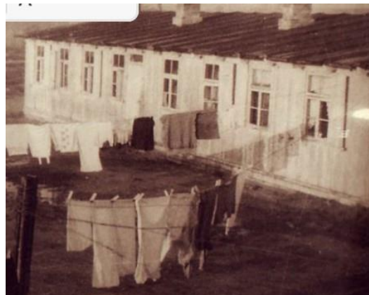
Foto af en typisk barak fra ukendt sted

Inden længe blev flygtningene samlet i større lejre, her på egnen i Rom lejren syd for Lemvig. Der var mangel på barakker og på svensk træ til barakker så når man flyttede flygtninge til et nyt sted så flyttede man også barakkerne med til det nye sted.